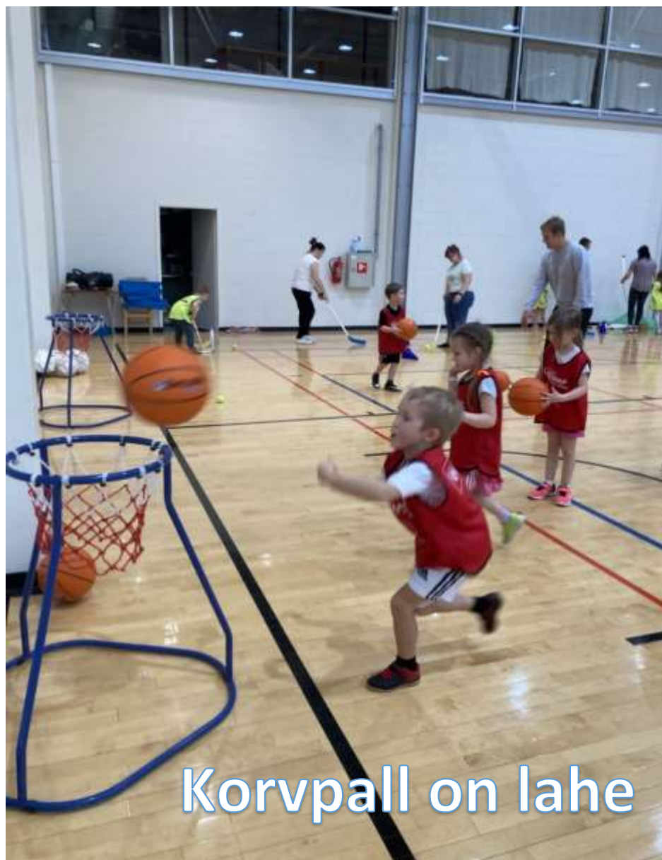
Korvpall on lahe